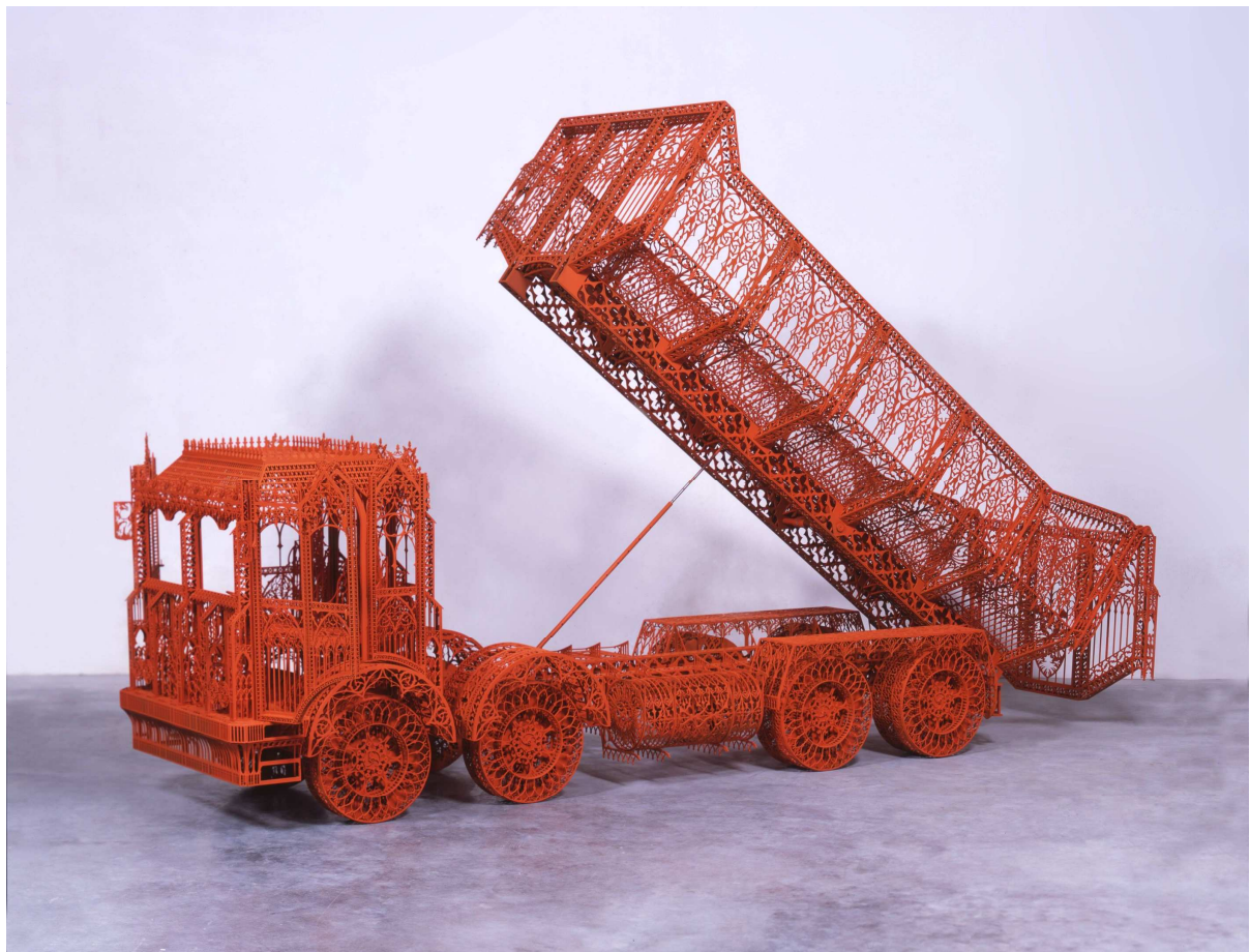
Wim Delvoye, Dump Truck , acier corten et laque orange, 278 x 83 x 98 cm, 2008 © Studio Wim Delvoye

Tradition et invention font ici bon ménage, associant matières nobles et matériaux contemporains, comme le marbre et la tôle perforée de Michel François , les galets enveloppés de fils de Lionel Estève ou les tiges d'acier et les matières plastiques d' Eva Rothschild .