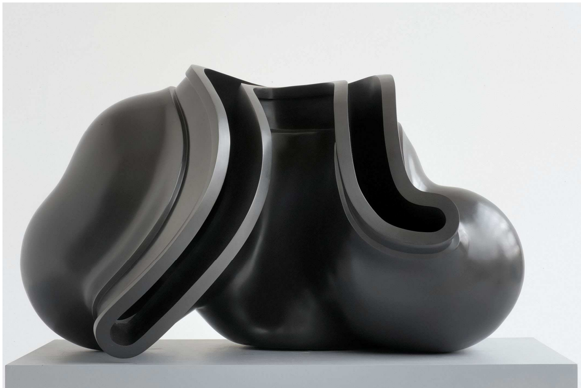
Tony Cragg, Early forms, bronze, 75 x 100 x 130 cm, 1993