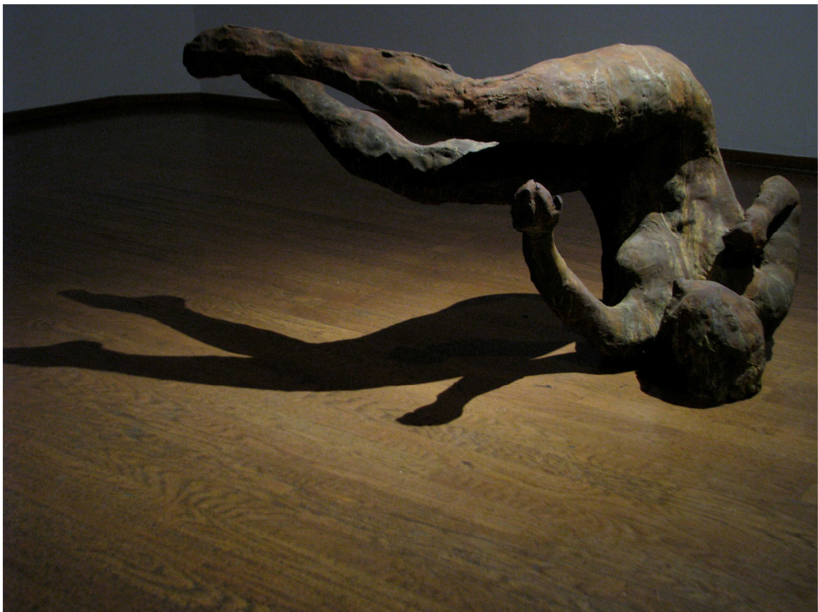
Eric Fischl, Tumbling woman , bronze, 2002 - Courtesy Galerie Daniel Templon, Paris Photo © Isabelle Bonzom/ADAGP