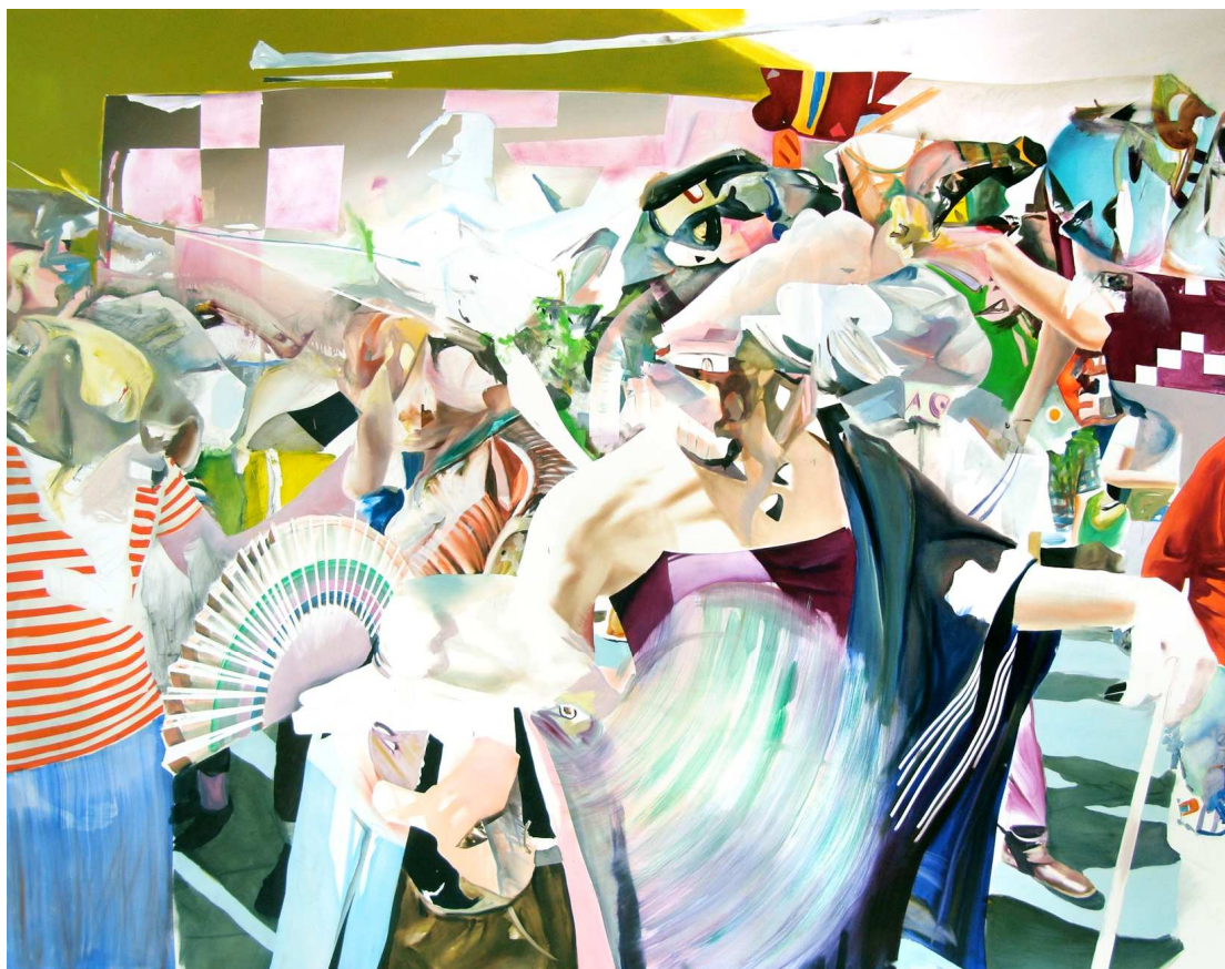
Robert Suermondt, La grande marche , huile sur toile, 200 X 260 cm, 2009 Courtesy Galerie Briobox, Paris