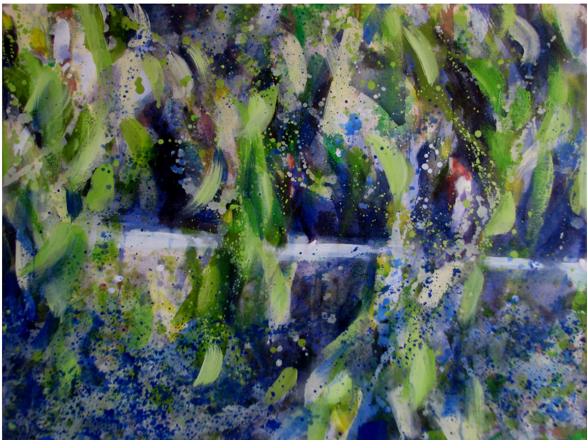
Isabelle Bonzom, Cascade VI , huile sur toile, 112 X 84 cm, 2009

Tous, en effet, témoignent d'un art contemporain vitaliste, c'est-à-dire, suscitant des perceptions intensément vécues. Ce sont des témoins actifs d'un plus de puissance de vie. Certains sont sculpteurs, d'autres, peintres, quelques-uns nous introduisent à l'art numérique. Pour chacun d'eux, l'art est inconcevable sans la vie et celle-ci ne suffit pas sans signes de vie. Que faisaient les Dogons, Cézanne, Chardin, Uccello, Vermeer, sinon entrelacer la vie, le monde et l'art ? Face à la pulsion de mort ambiante, Jouvences n'oppose cependant pas une superficielle euphorie hédoniste. Il y a de la gravité dans cette joie exposée.