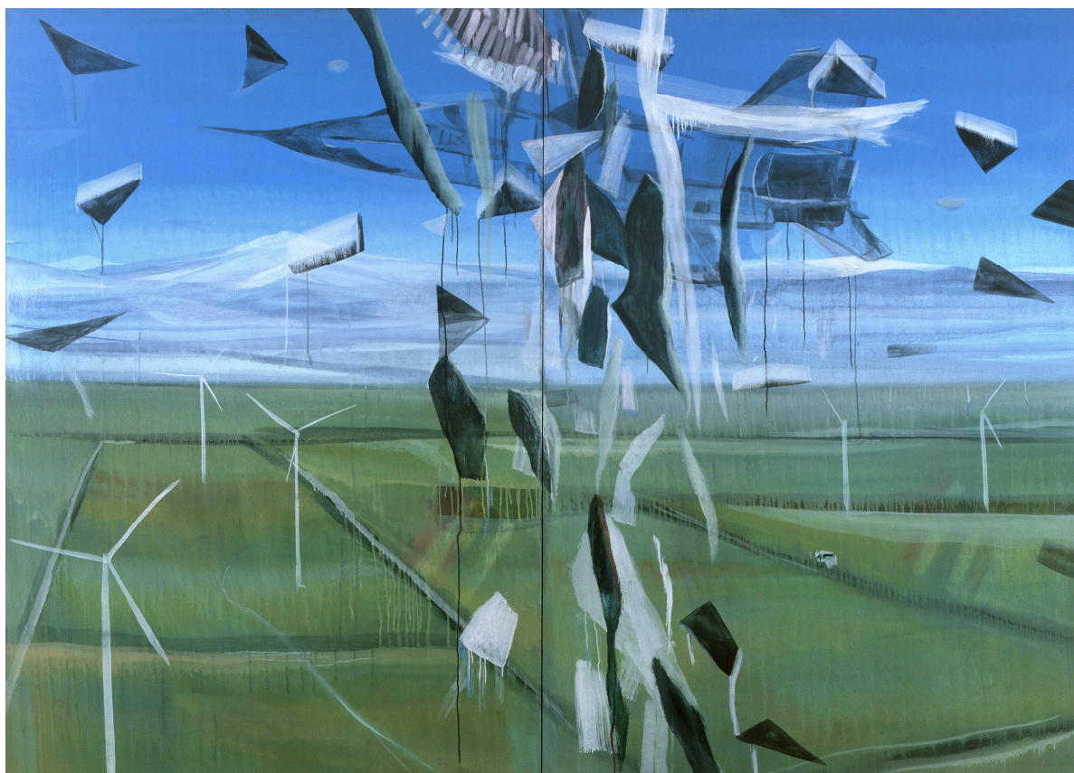
Marc Desgrandchamps, sans titre, huile sur toile, diptyque : 2 x (200 x 140) cm, 2009

Impossible de grouper sous une bannière les artistes ici présents, ils forment néanmoins une constellation de singularités ouverte à un large public. Tous proposent et expérimentent des forces qui deviennent formes. Ils nous permettent de tracer une cartographie de l'art contemporain qui serait intempestive aux yeux de la dominante culturelle actuelle.